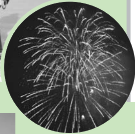
ラストを飾る ミニ花火大会