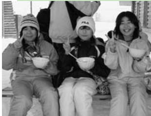
手打ちそばの試食「おいしそう!!」

打ちそば愛好会の方々による、そばうちの実演・試食会をはじめ、トナカイソリの無料運行、ゲーム大会、ミニ花火大会などが行われ、会場を訪れたたくさんの人たちは楽しい一日を過ごしていました。