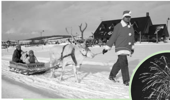
大人気だったトナカイソリ