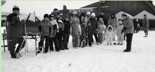
ミニゲーム「ホールインワン」