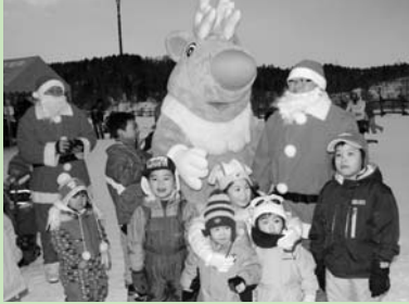
サンタクロースとホロベーとの記念撮影