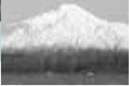
ペンケ沼で羽を休める白鳥