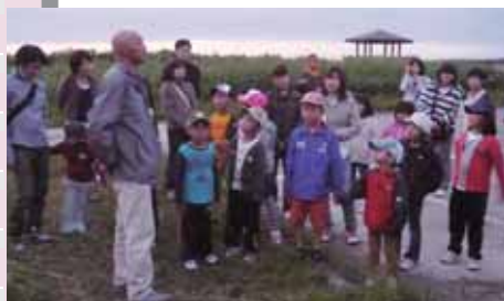
▲サロベツ原野をナイトハイク