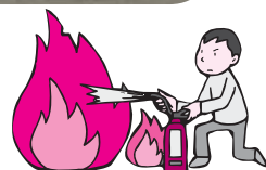
◀小さな消防士です ▼バケツリレーで消火