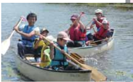
▲三日月湖でカヌー体験

翌24日(日)には、自然の中での遊び方などを学ぶため、元町の三日月湖でカヌー体験をしました。