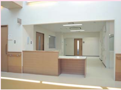
▲スタッフステーション