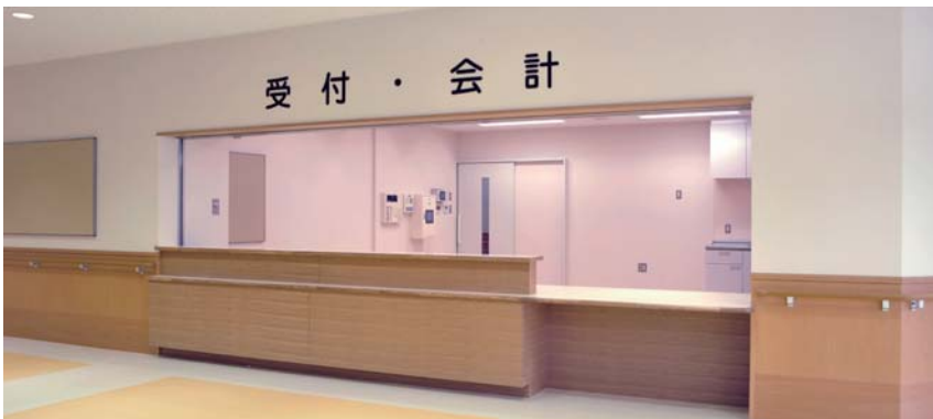
▲受付・待合いロビー