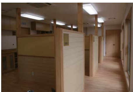
▼ 歯科診療所 診察室