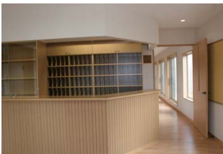
▲ 歯科診療所 受付

住所・電話番号 幌延町1条北2丁目2番地 電話 5-2353 FAX 5-1257