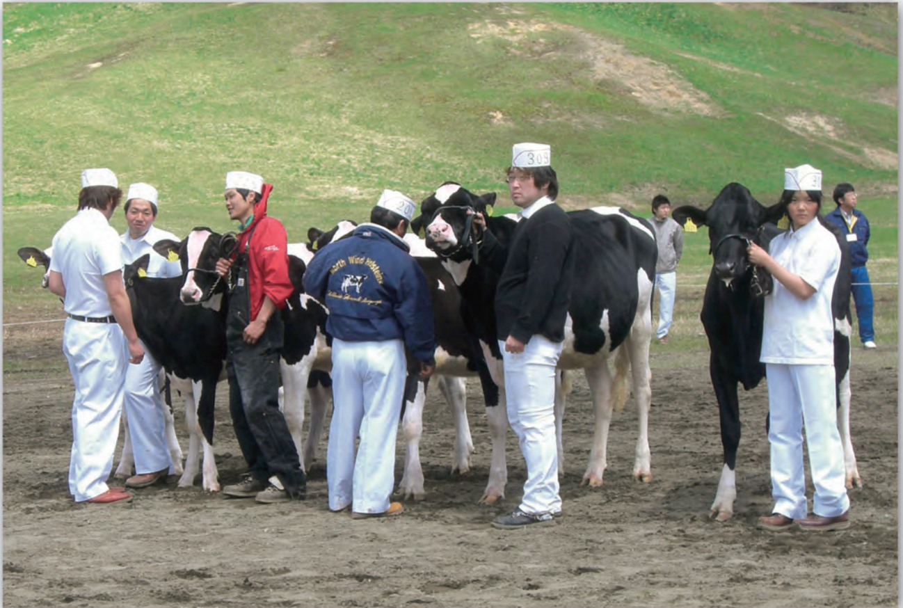
5月9日(水) 幌延町ホルスタインショー