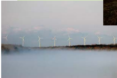
天塩川の朝霧と風車