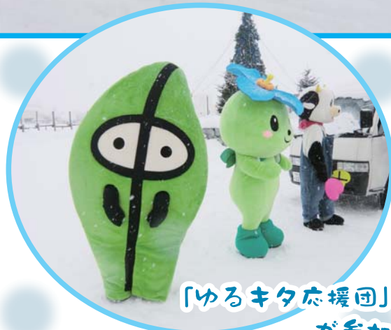
「ゆるキタ応援団」が参加