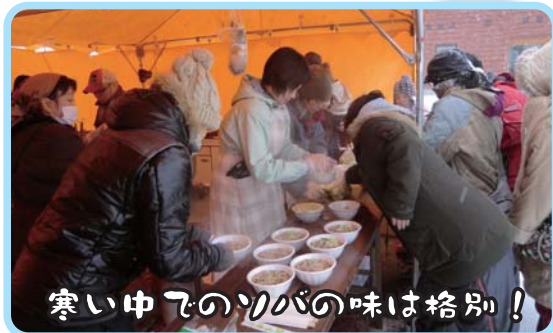
寒い中でのソバの味は格別!