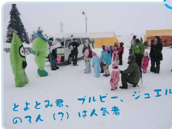
とよとみ君、ブルピー、ジュエルの3人(?)は人気者