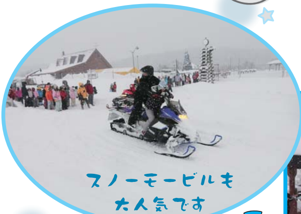
スノーモービルも大人気です