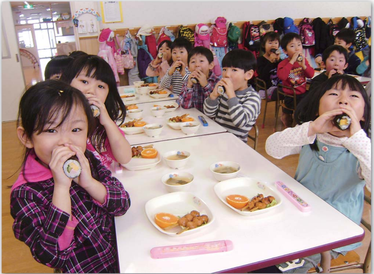
▲2月1日(金) 中央保育所で節分 恵方巻食べて福を呼ぼう!