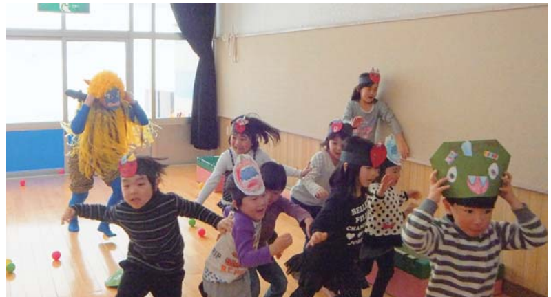
▲キャ〜!鬼を呼んじゃった。豆まきしなくちゃ!!