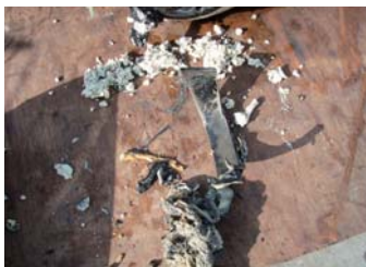
布きれ①・板状のもの