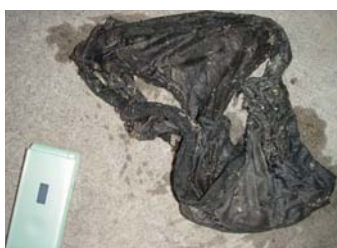
携帯電話・布きれ③