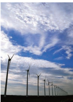
▶オートンルイ風力発電所