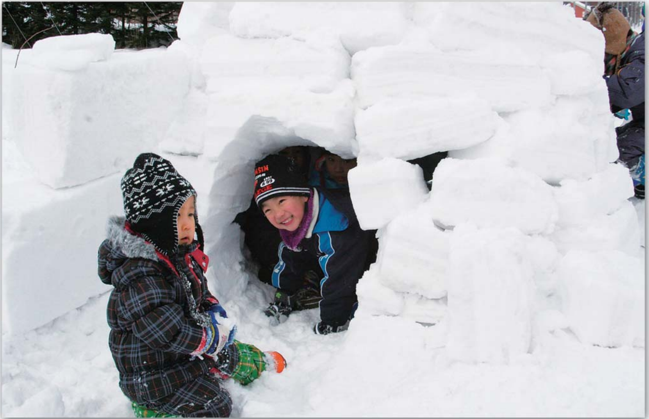
▲みんなで作ったイグルー 2月2日(日)チャレンジ教室 「雪と遊ぼう」