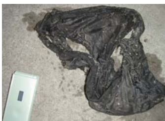
携帯電話・布きれ⑤