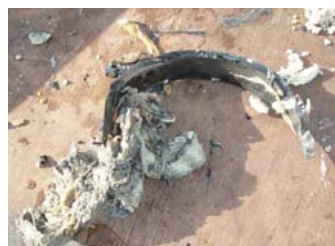
プラスチック片・布きれ⑥

異物が流れてくるたびに、ポンプが停止してしまいます。 修理や調整には時間を要するとともに、多額の経費がかかります。 ポンプが停止すると、マンホールから汚水があふれ、接続している建物の排水口から逆流する恐れがあります。 また、天ぷら油などの廃食油を流すと、家庭内の排水施設や下水道管が詰まる原因になりますので、絶対に流さないください。