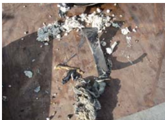
布きれ②・板状のもの