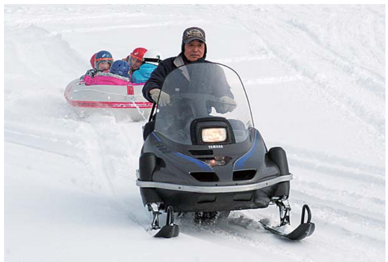
▲ゴムボートで雪原を滑走