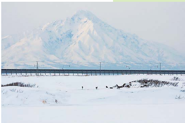
利尻富士とエゾシカ