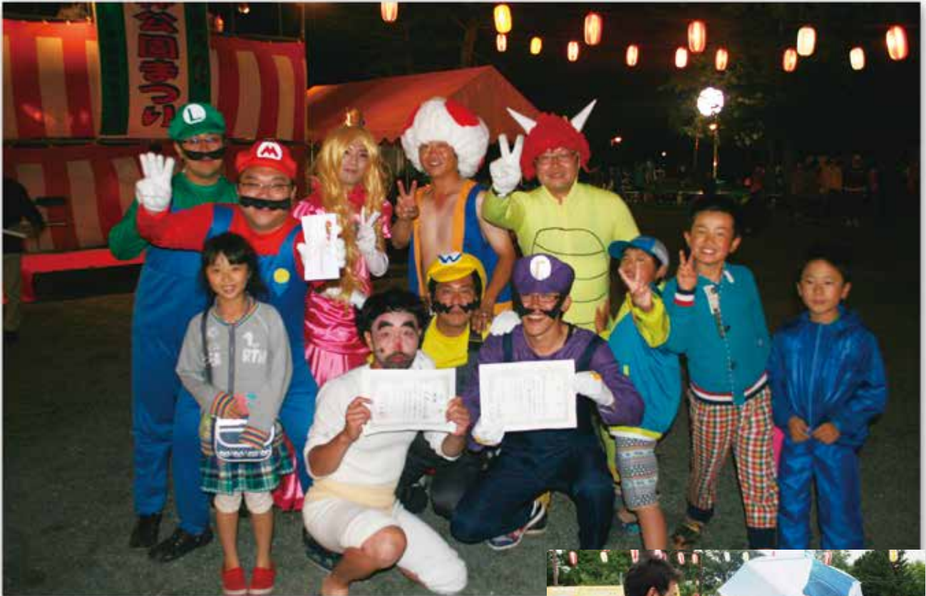
▲ 仮装盆踊り大会個人・団体の部優勝者 (変なおじさん・みなさまおなじみの)