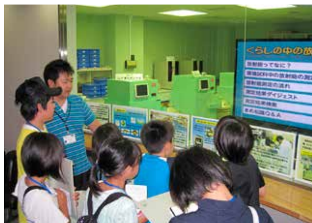
▲原子力環境センター