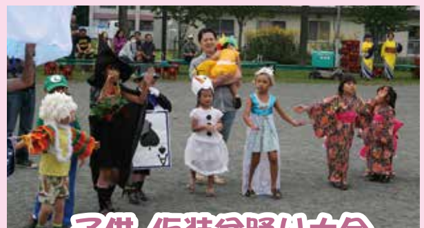
子供 仮装盆踊り大会