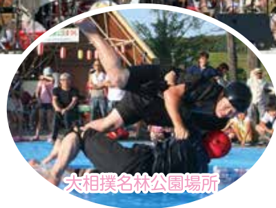
大相撲名林公園場所