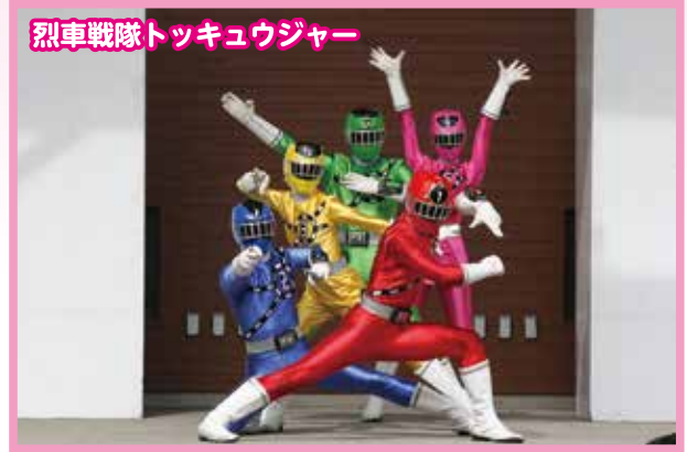
列車戦隊トッキュウジャー