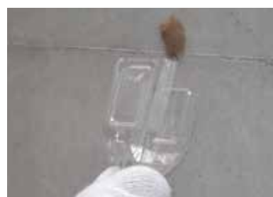
底部を切り取ったペットボトルで剥ぎ取る