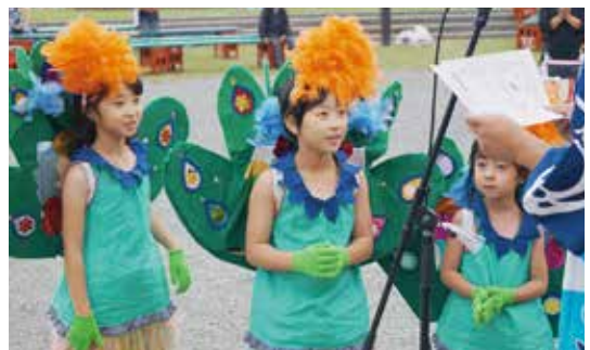
▲ 子供仮装盆踊り団体の部優勝 (孔雀)