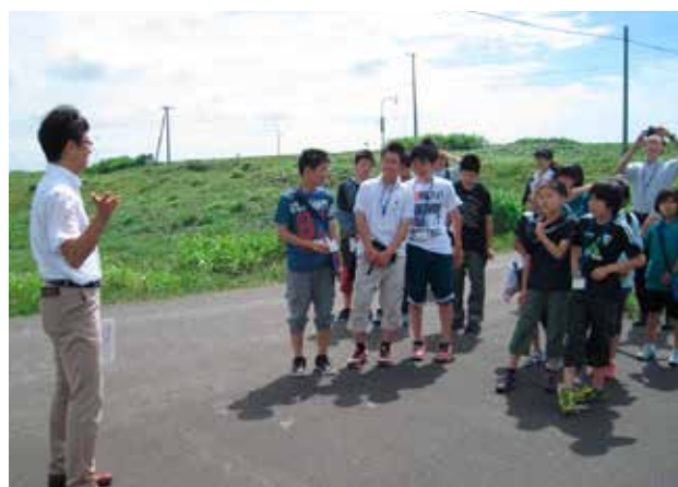
▲オトンルイ風力発電所