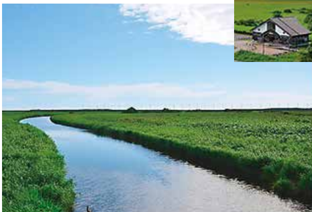
オンネベツ川と風車