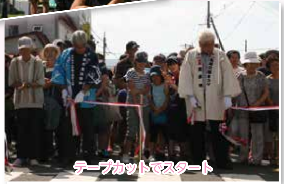
テープカットでスタート