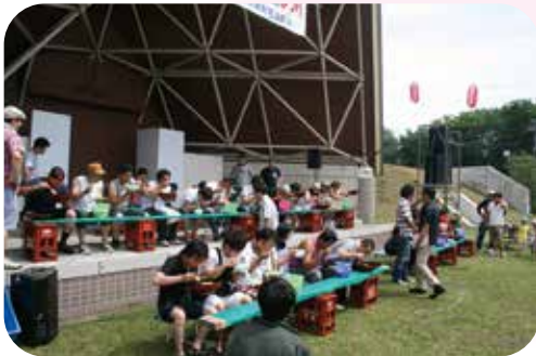
メガ盛り早食いキツイじゃ～