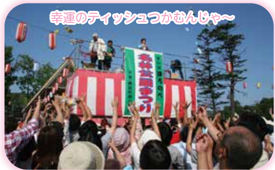
幸運のティッシュつかむんじゃ〜