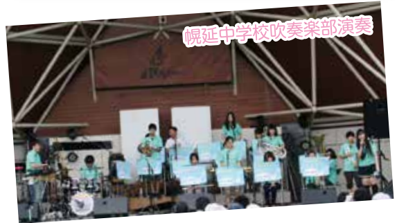
幌延中学校吹奏楽部演奏