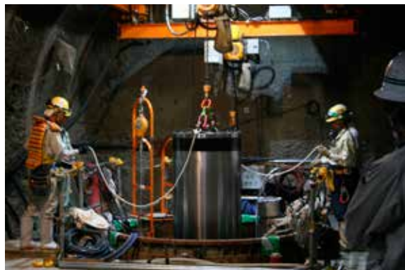
◇模擬オーバーパック（金属容器）の試験孔内への定置試験の様子

http://www.jaea.go.jp/04/horonobe/index.html