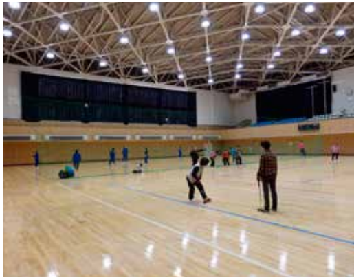
総合体育館：アリーナ

9月から2月まで総工費223,452千円をかけ改修工事を行いました。改修工事に伴い、臨時休館していましたが、3月1日より利用を開始しました。長期臨時休館中は、皆さんに大変ご不便をおかけしました。利用開始日から、子どもから大人まで、たくさんの方々が利用しており、各団体等も久しぶりに総合体育館で行う運動やスポーツを思う存分楽しんでおりました。今回の改修は主にアリーナ内の設備関係を重点的に行っており、利用者からは、「床もきれいで、照明も明るく、アリーナも暖かい」と大好評でした。また、幌延町民プールは6月第2土曜日から利用開始となります。