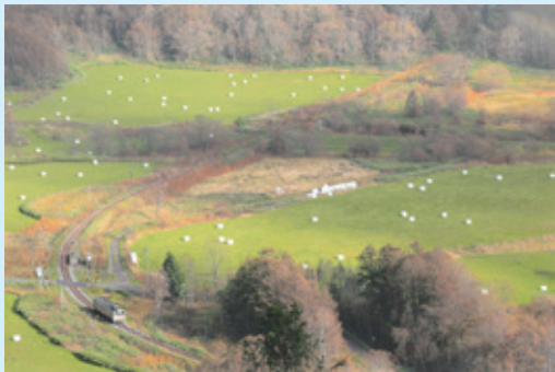
◀牧草ロールのある風景：佐々木 正巳 様▶

糠南駅を上から見下ろす「糠南俯瞰」との愛称で親しまれる鉄道写真愛好家に有名なスポットです。ここは笹が生い茂り撮影はなかなか大変なのですが、幌延らしいロールが転がる牧草地帯を駆け抜ける気動車と光の加減が絶妙な作品です。