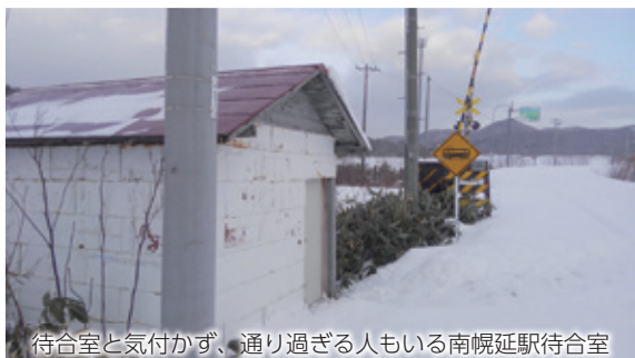
待合室と気付かず、通り過ぎる人もいる南幌延駅待合室

岡山から来ました。前回来た時は15年前位で、今より待合室は、ひどかったと思います。ドアも開けやすくなり、中もきれいになった感じです。ここ最近、北海道の鉄道が、いろいろ言われていますが、やはりレールがあり、駅がありだと思ってくれる方があれば力になっていきたいです。』