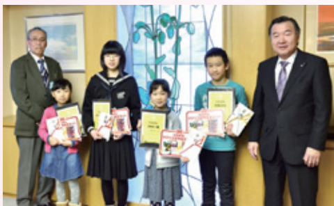
【アイデアコンテスト受賞者のみなさん】