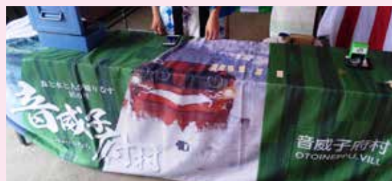
▲箄島駅硬券入場券販売会の様子

6日の日は、硬券販売はそのまま箄島駅前でも、おまつり会場は移動し天塩川河川敷にて、フォークソング