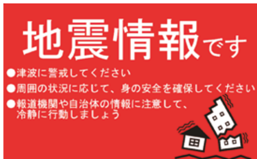
【緊急地震速報】告知配信画像 11月1日（水）に配信されます。

*Jアラートとは、地震・津波や武力攻撃などの緊急情報を、国から人工衛星などを通じて瞬時にお伝えするシステムです。