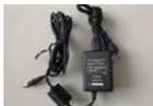
告知端末機用電源アダプター