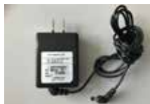
ONU用電源アダプター