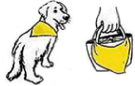
バンダナ 袋 わんわんパトロール

普段、何気なく散歩をしているコースでも、意識して目を向けると普段と違ってあることに気付くことがあります。何かお気づきのことがあれば、すぐにお知らせください。