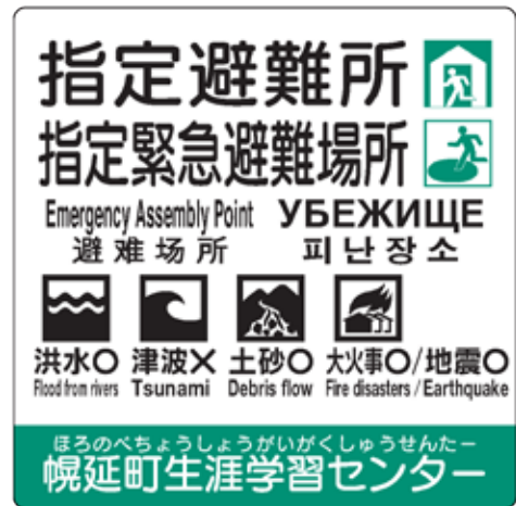
標識板のイメージ

標識板には、災害の種類とその横に○または×印が表示されています。○印はその災害が起きた際に避難できる場所ということを意味します。なお、×印はその災害の避難場所として適していないという意味ですので、災害発生時に間違えることのないように、普段からの確認をお願いします。