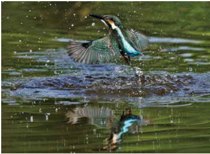
「水辺の青い宝石 カワセミの水浴」

盛夏の昼下がり、沼岸に設営したブラインド（撮影用の小型テント）の中で待機していた時のことです。小魚を捕食しにやって来たカワセミが、狩りではなく面白い行動を始めました。