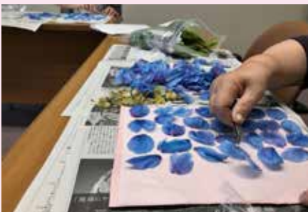
ブルーポピー押し花作業の様子

現在「ホロカル」では、移住の相談受付や観光案内業務などを行っており、「ほろのべの見どころ行きどころ」と称し、町内のお花など植物の最新の開花状況の掲出もしています。今の時期は色鮮やかなお花がたくさん咲いています。湿原やトナカイ観光牧場・海岸線などへ足を運び実際に目で見て、旬の情報を発信していますので、ぜひ皆さまにもご覧いただき、おでかけのきっかけにさせていただければと思います。