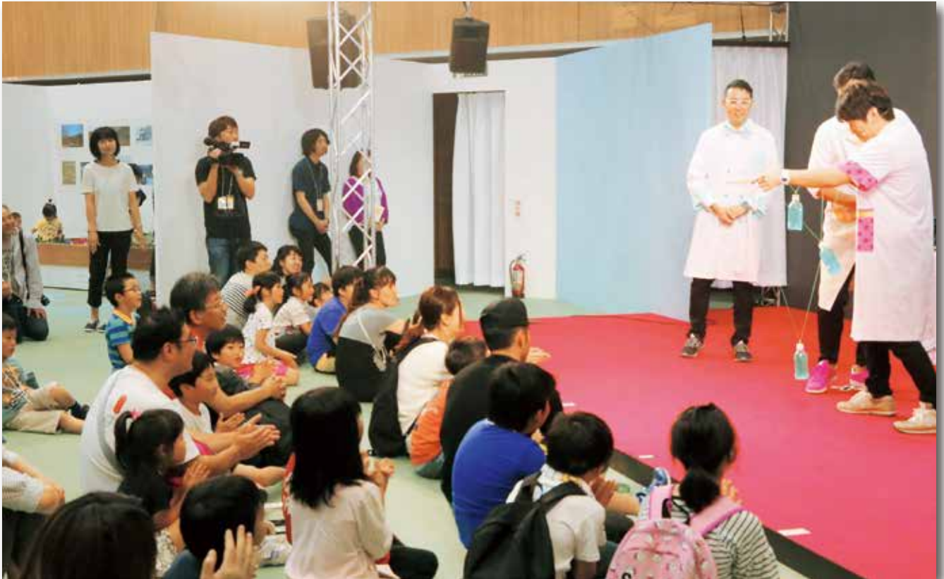
▲おもしろ科学館2018 in ほろのべ