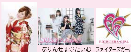
社 このみ ぶりんせす♡たいむ ファイターズガール

お問い合わせ先：産業振興課 企画振興グループ 電話：5-1113 告知端末機：5-8814