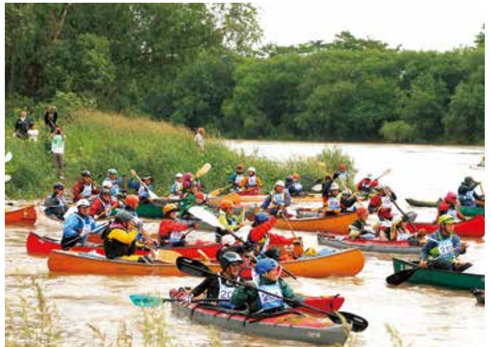
▲ダウン・ザ・テッシ-オ-ペツ スペシャル2018