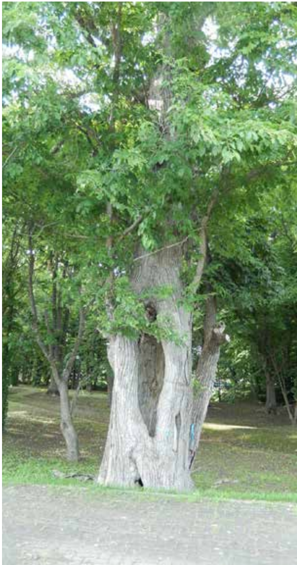
名 林 公 園 樹 木

法も考えた方がいいのではないかと。診断結果が、すぐにも倒木の危険性がある木については、伐採しなければならぬが、何か手を加えることで、その木が安全に維持できるのであれば、木をもたすことも視野にいれて考えている。