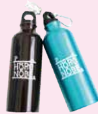
幌延町オリジナルボトル