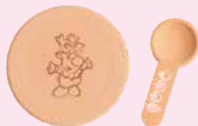
珪藻土コースター & スプーン