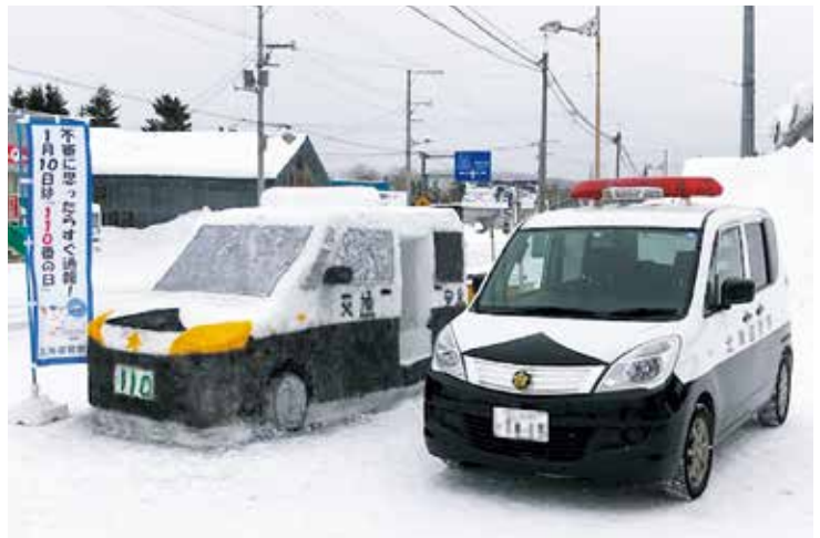
▲パトカーの雪像 (問寒別駐在所)