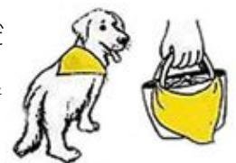
バンドナ 袋 わんわんパトロール

普段、何気なく散歩をしているコースでも、意識して目を向けると普段と違うことに気付くことがあります。何かお気づきのことがあれば、すぐにお知らせください。