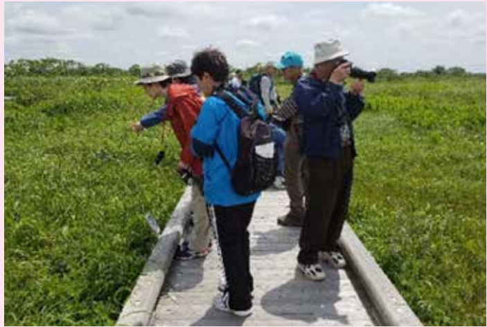
花を観察する参加者

これから「おもしろ科学館」や「名林公園まつり」など大きなイベントが続きます。私にとって初めての町内イベントへの参加となるので、町民の皆さまにお会いできることを楽しみにしています。