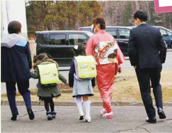
入学式お疲れ様でした。明日から頑張ってくださいね！