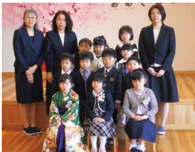
問寒別へき地保育所 卒所式