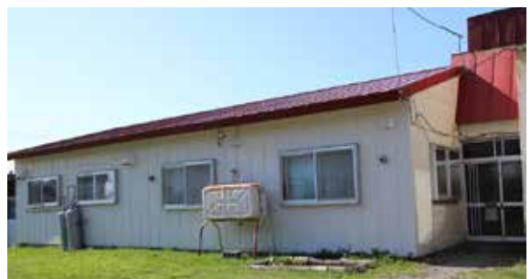
グループホーム しらかば寮

保健師が本庁舎に移動したことで経費は若干少なくなる見込みだが、社会福祉協議会が入っていることや事業等で保健センターを使用すること等を考慮し、予算計上した。