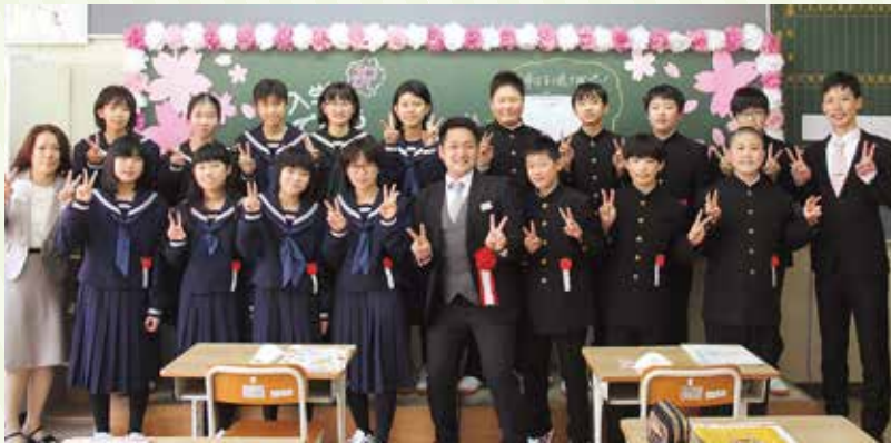
小学生から中学生に。一步大人に近づきました！