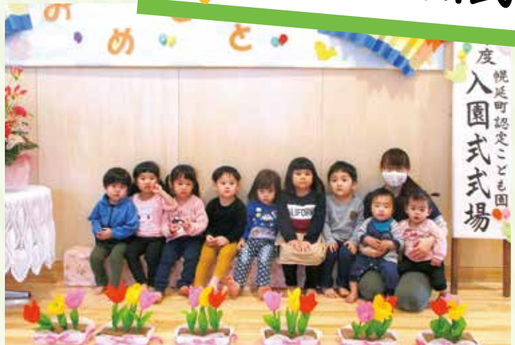
ちよつぱり緊張した入園式