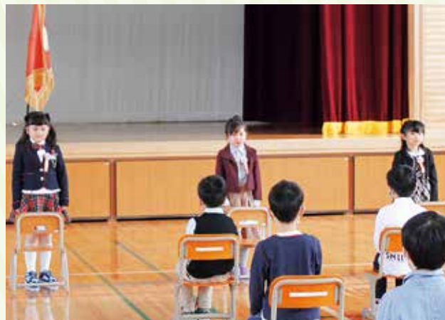
3人の入学生。在校生と先生たちは温かく迎えてくれました