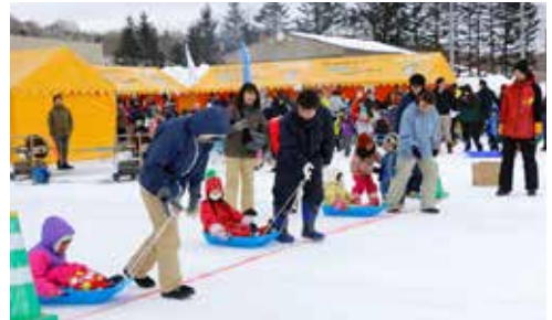
ほろのべ雪ん子まつり