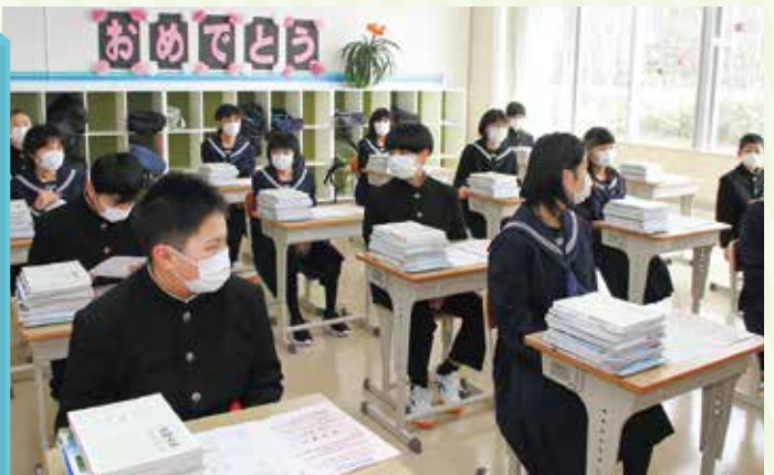
初めての教室。たくさんの教材をもらいました