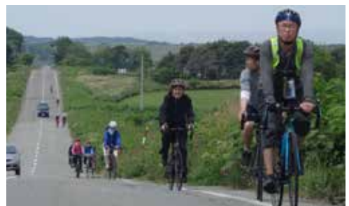
チャリ・デ・秘境駅