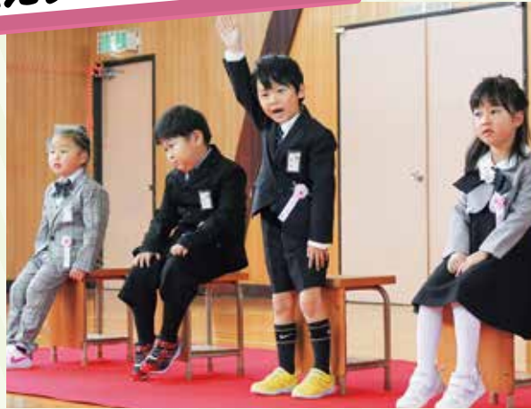
名前を呼ばれて元気よく挨拶！