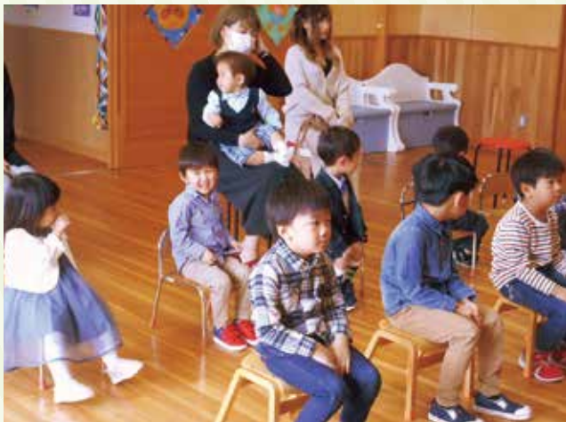
問寒別へき地保育所の入所式 成長した姿を見るのが楽しみです！