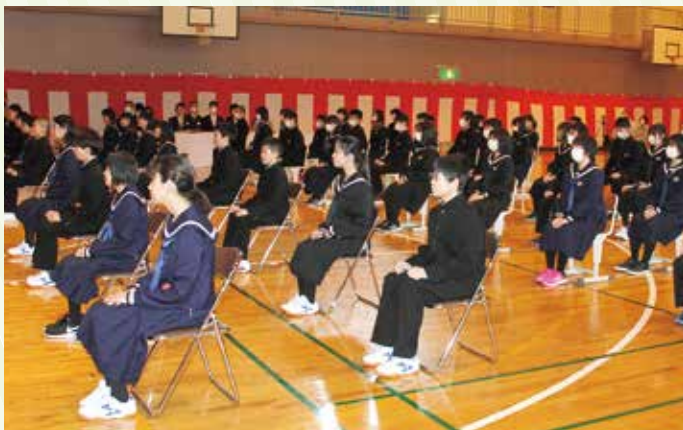
先生のお話をしっかりと静聴している生徒たち