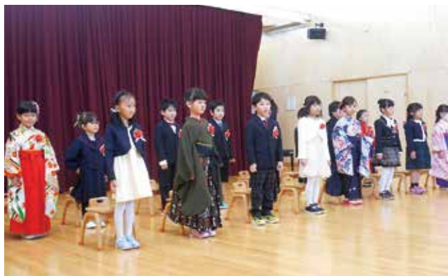
認定こども園 卒園式