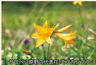
サロベツ原野の代表花 エゾカンゾウ