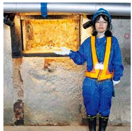
写真2 深度250m調査坑道の岩盤

珪藻の一部が溶けて周りの珪藻間の隙間 (a) や珪藻自体の穴 (b) に入って、鉱物として再び固まっている様子が確認できます。