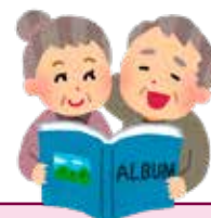
今昔フォトコンテスト PRポスター (memo'tock作成)