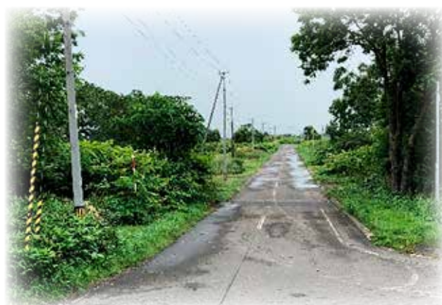
雨上がりの安牛駅前通り