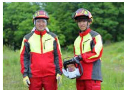
北森カレッジ第1期生