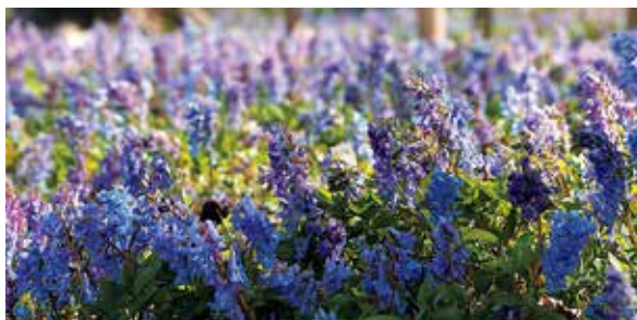
名林公園に咲く「エゾエンゴサク」

■暑くてじとじとした8月がようやく終わろうとしています。コロナ対策としてマスクを着用するには少々息苦しく過ごしにくかったです。暑さのおかげでアイスが美味しい一月でもありましたね。アイスの食べすぎなどによる夏バテには注意していきたいです。 ■さて、8月といえば名林公園まつりというイメージなのですが、今年は開催されず残念です。例年、9月号の裏窓には名林公園まつりで広報誌用の写真を撮影した感想などが書かれていたのですが、来今からとても楽しみにしています。 ■また、名林公園はお祭りだけでなく、きれいな花も咲いています。4月には辺り一面が花でびっしりと埋め尽くされているので、それを見ることも楽しみの一つです。まだ見たことがない方には、ぜひ見に行ってもらいたいですね。