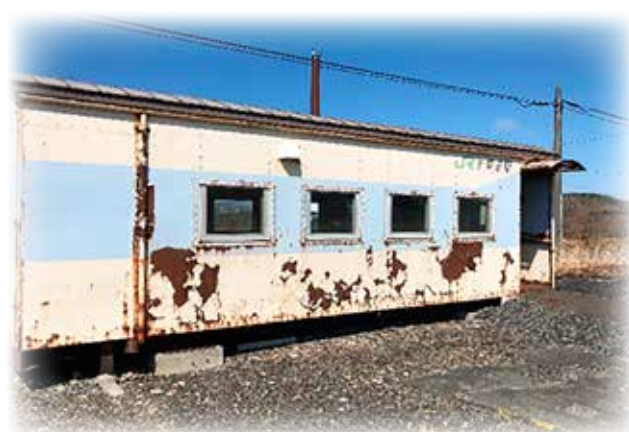
青空の下に佇む上幌延駅 駅舎

お問い合わせ先：企画政策課 地域おこし協力隊 電話 5-1114 告知端末 5-8814