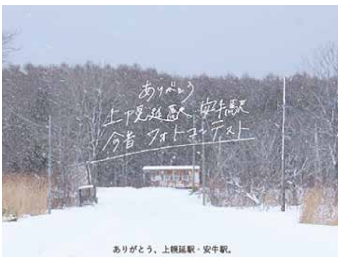
ありがとう、上幌延駅・安牛駅。

なお、作品としての応募ではなく、昔懐かしい写真のご提供も大歓迎です。お申し出くだされば、地域おこし協力隊員などがお伺いさせていただきますのでご連絡ください。