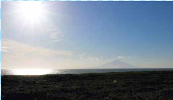
浜里 オロロンラインから