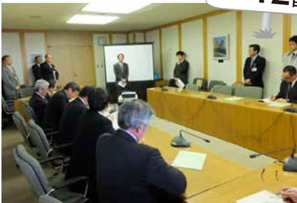
幌延町議会議員説明会