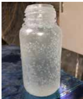
【地下施設の岩盤内から採取した地下水の写真】 水の中から現れる泡は、主に二酸化炭素やメタンであることが分かっています。