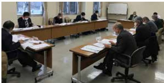
令和3年2月15日開催の幌延町総合計画審議会の様子

町では答申を踏まえ、3月17日付けで第6次幌延町総合計画前期基本計画を策定しました。なお、計画の概要については、広報誌5月号でお知らせします。