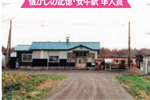
◀ありし日の安牛駅 : クマタカ 様▶

令和3年3月に廃止された「上幌延駅」と「安牛駅」のフォトコンテスト応募作品の主なものを連載でご紹介しています。