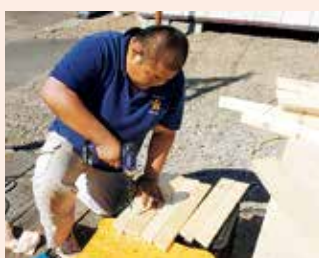
ワークショップ前の事前作業

幌延町をはじめ、道北地域を訪れるサイクリストを見かける機会が年々増えています。サイクルラックを活用して