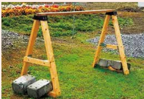
サイクルラックの完成品

また、サイクルラックの一部(天板)は、ワインやクラフトジンの樽にも使用されている「北海道大学天塩研究林内のミズナラ材」が使われており、さりげなく幌延町をアピールしています。