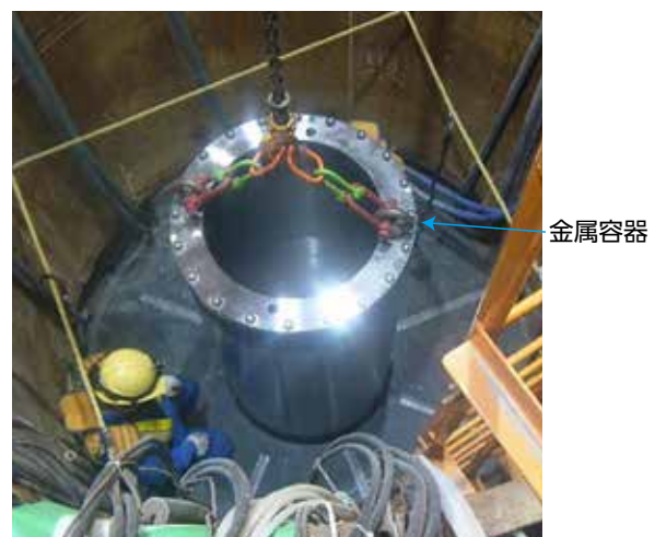
金属容器を設置している様子