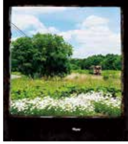
《夏の小窓 : つよぼむ 様》

令和3年3月に廃止された「上幌延駅」と「安牛駅」のフォトコンテスト応募作品の主なものを連載で紹介しています。