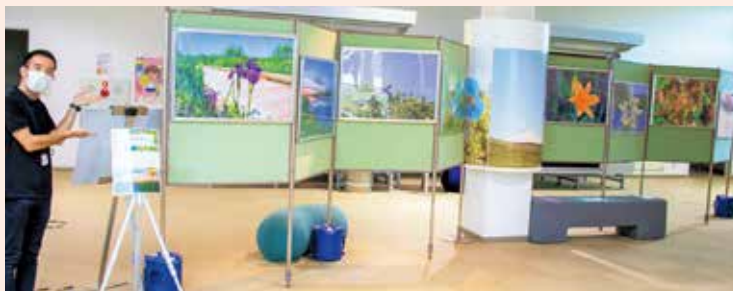
ゆめ地創館内に展示されたサロベツ原野の風景や草花の写真

私がこれまで撮りためてきた写真が思ってもみなかった形で使っていただけることは大変ありがたいことです。これからもサロベツ原野について、町内外問わず色々な方に発信していけたら嬉しいです。