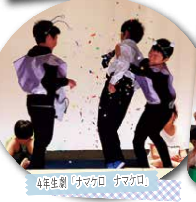
4年生劇「ナマケロ ナマケロ」