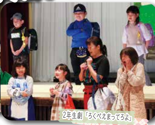
2年生劇「ろくべえまってるよ」