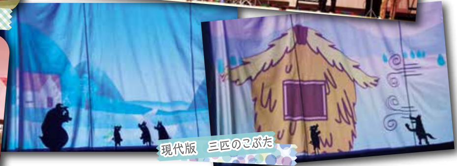
現代版 三匹のこぶた