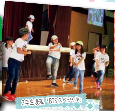
3年生表現「BTSスペシャル」