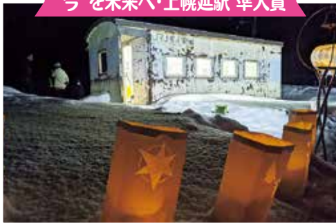
〈別れの準備 : あんどう 様〉

令和3年3月に廃止された「上幌延駅」と「安牛駅」のフォトコンテスト応募作品の主なものを連載でご紹介しています。