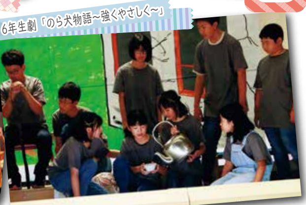
6年生劇「のら犬物語〜強くやさしく〜」