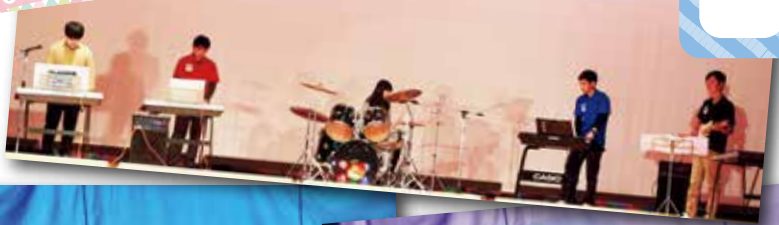
ステージで輝く12人の音楽隊