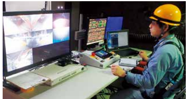
写真1 PEMを運ぶ試験の様子（圧縮空気を送り込み、床面との隙間に薄い空気膜を作ることで摩擦を減らし、小さい力で重量物を運びます。すべて遠隔で操作します。）