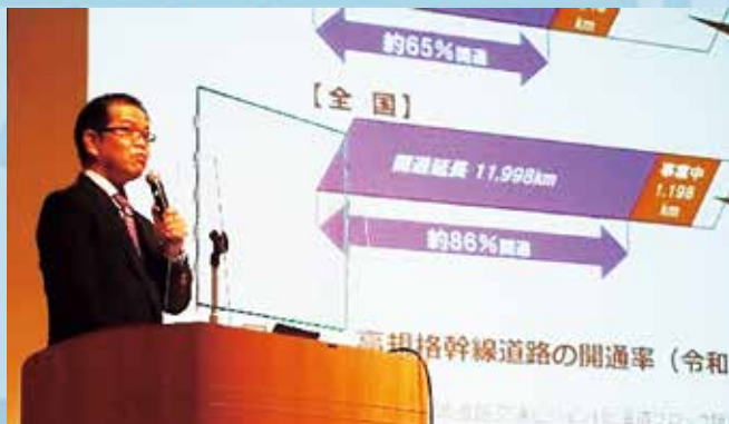
講演を行う北海道大学公共政策大学院 岸教授