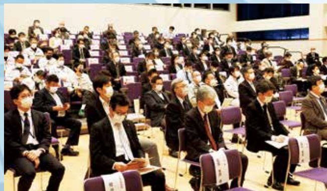
フォーラム会場の様子