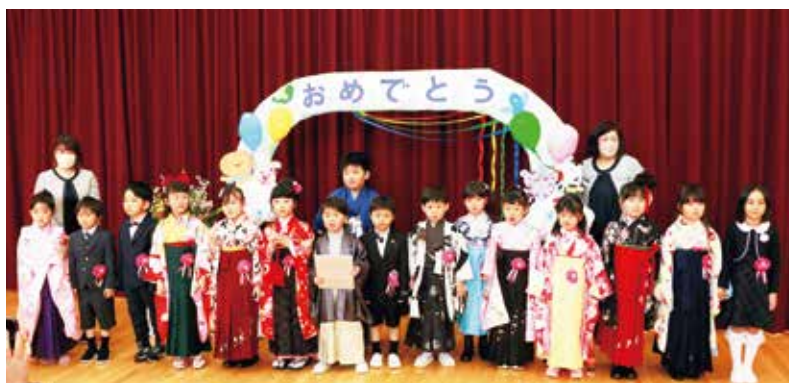
認定こども園卒園式