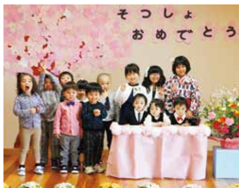
へき地保育所卒所式