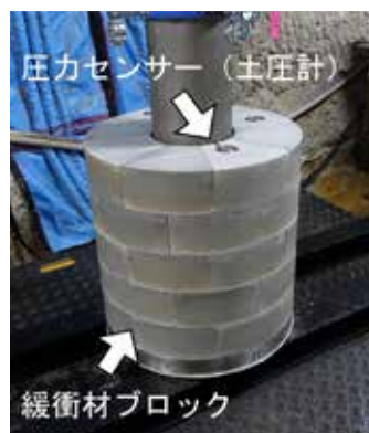
写真1 緩衝材ブロック