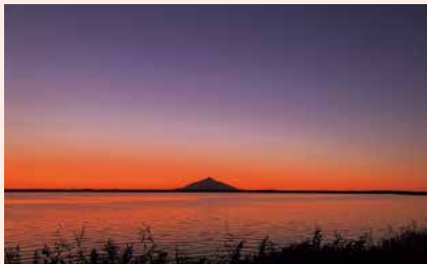
宝物のひとつ「夕暮れのパンケ沼」です