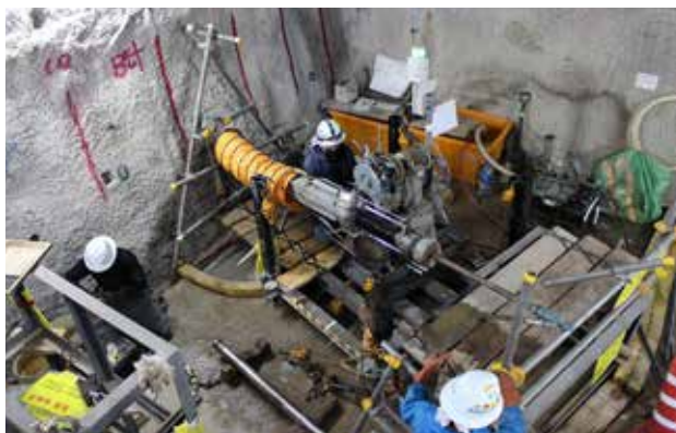
写真 深度250mからのボーリング調査の様子