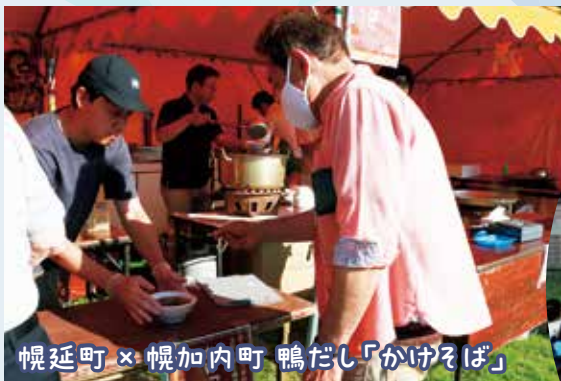
幌延町 × 幌加内町 鴨だし「かけそば」