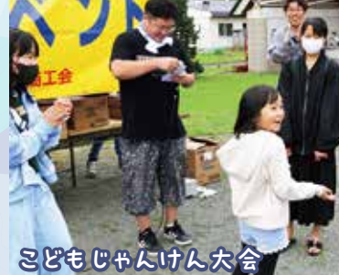
こどもじゃんけん大会