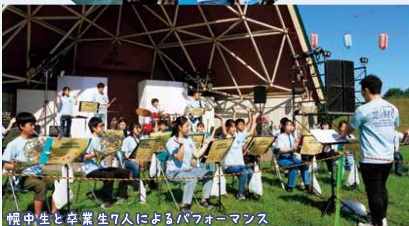
幌中生と卒業生7人によるパフォーマンス