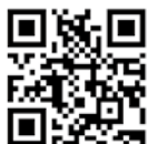
幌延町ウェブサイト

QRコードを読み込むと幌延町のホームページを見ることができよ。過去の広報誌もあるから読んでみてね。