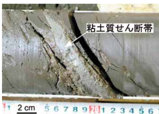
写真1 粘土質せん断帯のコア試料の例

* 1：せん断帯とは、物がずれる変形（せん断変形）が集中する帯状の地質構造のことで、断層はその代表例です。