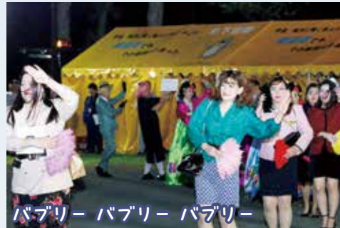
バブリー バブリー バブリー