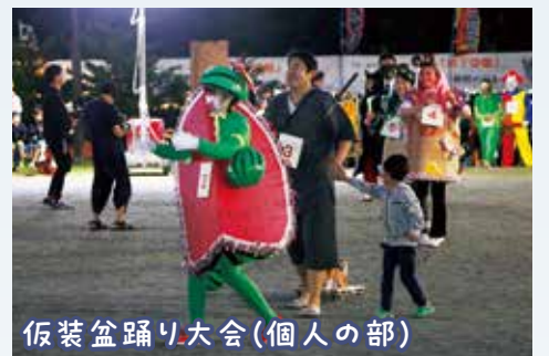
仮装盆踊り大会(個人の部)