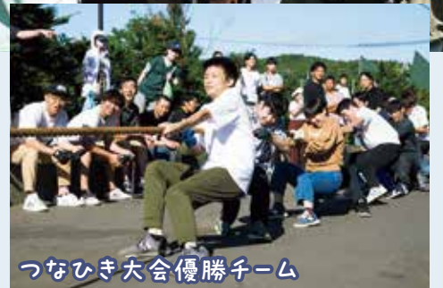
つなひき大会優勝チーム