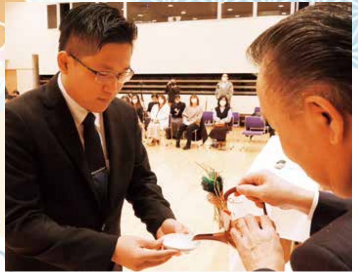
お屠蘇を頂く成人の皆さん