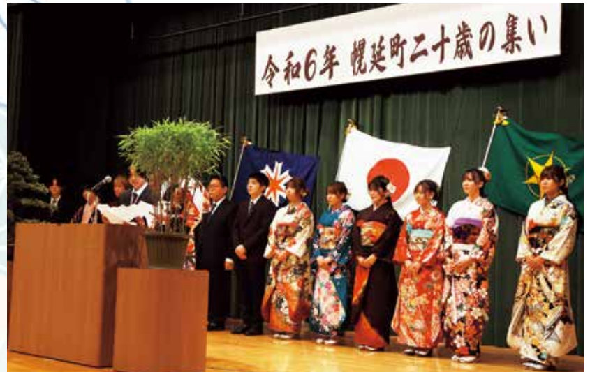
壇上で誓いの言葉を述べる成人の皆さん