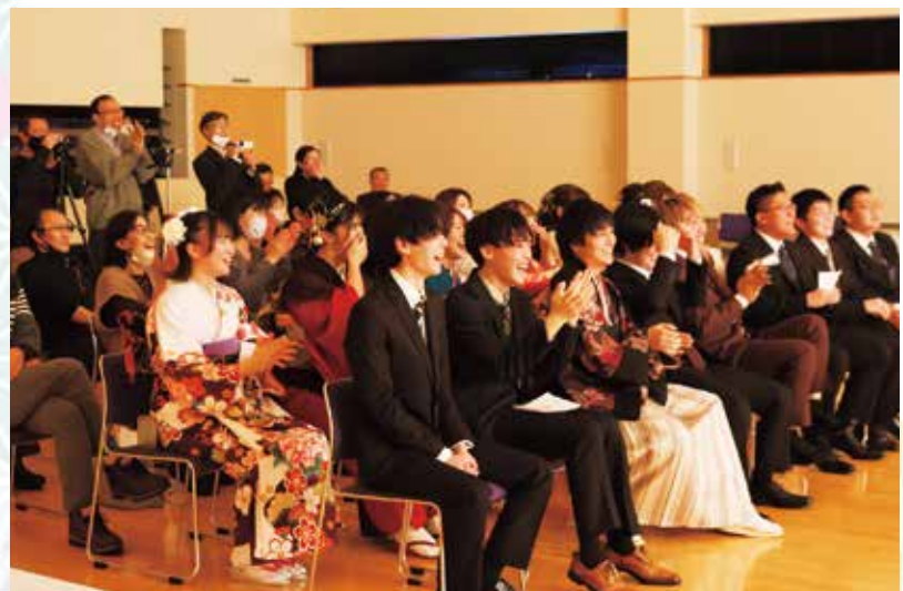
中学校の担任のサプライズ登場に驚き喜ぶ成人の皆さん