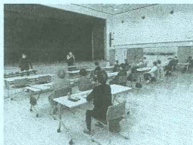
〔令和5年度学習会の様子〕