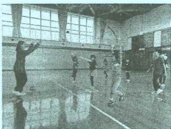
〔企画事業：ダンス教室の様子〕

登録希望者は学校で配付される申込書に必要事項を記入し、幌延町生涯学習センター又は教育委員会に提出してください。