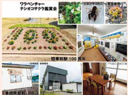
事務所移転・行事

協力隊は1年ごとの契約更新で最長3年の任期となります。まずは1年無事務められたことを感謝しております。