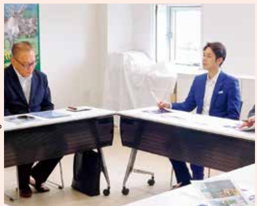
鈴木知事との懇談