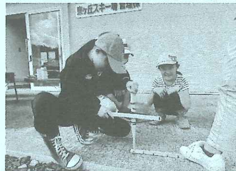
火おこしの様子(令和5年度の様子)

ふるさと自然体験チャレンジ教室への参加を希望される場合は、会員登録が必要となりますので、裏面の問い合わせ先までご連絡願います。