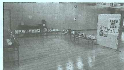
認定こども園遊戯室

期 日 8月26日(月) 時 間 15:30~18:00 場 所 認定こども園 遊戯室 内 容 絵本、一般図書100冊程度を展示・貸出します。