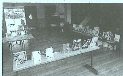
問寒別へき地保育所遊戯室