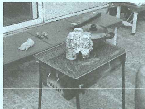
空き缶炊飯(令和5年度の様子)