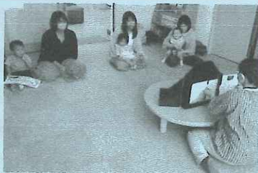
第3回読み聞かせ会の様子

かおだあれ」「おおきくおおきくおおきくなあれ」の 3冊の紙芝居を読み聞かせしました。特に虫の頭部の アップを中心とした「かおかおだあれ」では保護者も 幼児も興味津々で聞いていました。