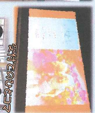
受付でのひととき

上映前の観覧中に、幌延町に実習に来ている名寄市立大学の学生さんとおしゃべりする機会もありました。さて、こんな映画が観たい！などのリンクエントをお待ちしています♪思いついたらいつでも教えてくださいな♪