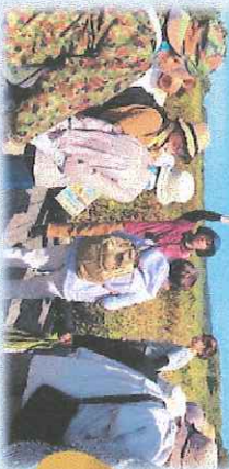
歴史の良さを感じた1日