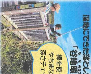
湿地にできた落とし穴 「谷地眼」