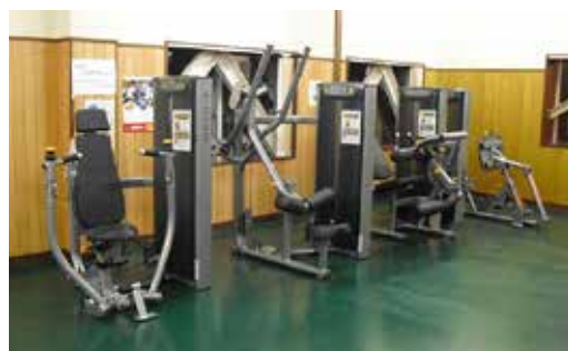
新しいトレーニングマシン

答 弁 総合体育館の機器用具等は、劣化状況を確認し、計画的に更新している。昨年度から2か年計画でトレーニング機器の入れ替えをして利用も増えた。また、ドッチビーやフロアカーリングを導入しており、レクリエーション感覚で年齢や体力、障害を問わず気軽に楽しむことができる。町民の健康増進を図るため、ボ