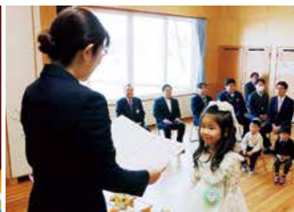
▶問寒別へき地保育所