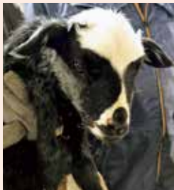
ロマノフスキーの赤ちゃん

これからは、トナカイ牧場やノースガーデン、そして幌延ビジターセンターなど、町の魅力をX(旧Twitter)などでたくさんお届けしていきます。