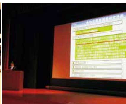
▶センター職員による説明