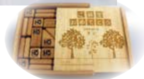
▶贈呈された積み木