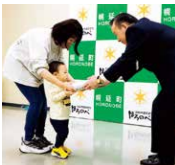
▶町長から記念品の積み木の贈呈

記念品は、町産のミズナラ材を使用して製作した「積み木」であり、本事業は自然豊かな環境に幼少期から触れる機会を作るという意味を含め今回で4回目の実施となります。