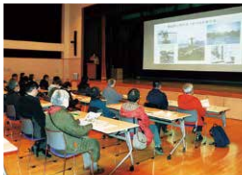
▶幌延深地層研究センター国際交流施設