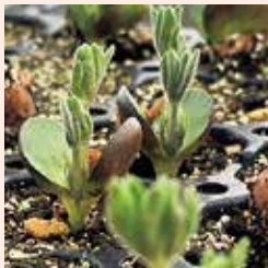
ノースガーデンのビニールハウスで芽吹いたルピナス