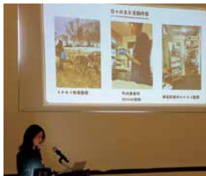
▶問寒別生涯学習センター

既に活動中の隊員4名から、現在の活動状況や今後取り組んでいきたいことなどの報告発表とあわせて、2月に着任した隊員2名の自己紹介があり、来場者から活発な質疑応答や応援の言葉をいただきました。